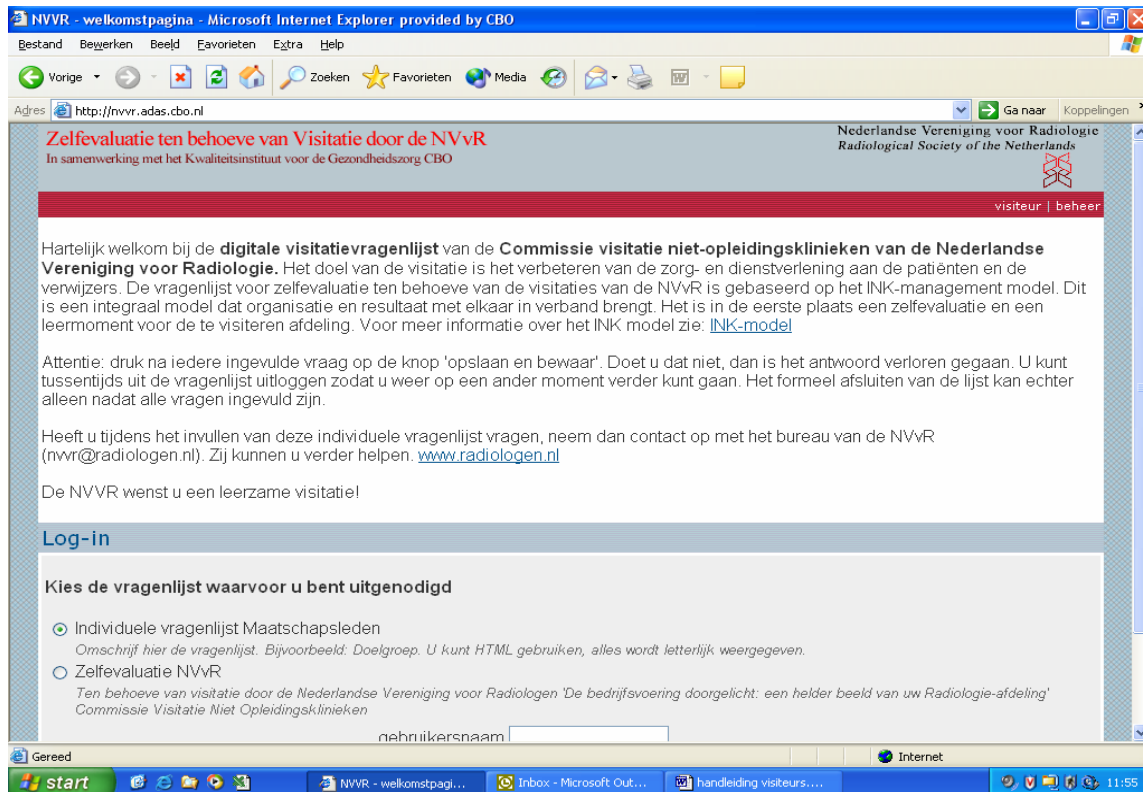
Figuur 2: Welkomspagina in het ADAS-systeem gebruikt bij visitaties

groot deel van de papieren rompslomp. Analogoos aan de PACS-installaties gaat de commissie ook richting papierloos!