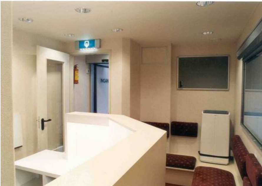
Interieur Mammobil Svokon

Niet alleen in ons land werden deze uitspraken voorpaginanieuws. Het gevolg was dat in brede kring het algemeen bestaande vertrouwen in de mammascreening was ondermijnd.