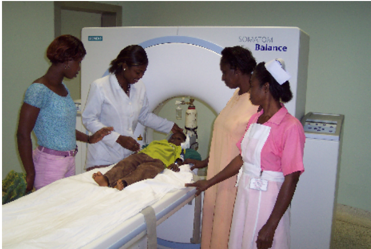
Foto 5: Een 4-jarig kind na een verkeersongeval met een schedelbasisfractuur.

In die dagen overleed de moeder van de hoofdlaborant. Voor Ashanti's is weinig belangrijker dan begrafenissen, en het zou als hoofd van de afdeling een grove fout zijn haar begrafenis niet bij te wonen. Dit werd mij door Nana tactvol ingefluisterd, waarna hij mij, als gast in zijn officiële gevolg, uitnodigde. Nieuwsgierig naar zijn leven buiten het ziekenhuis, nam ik de uitnodiging aan.