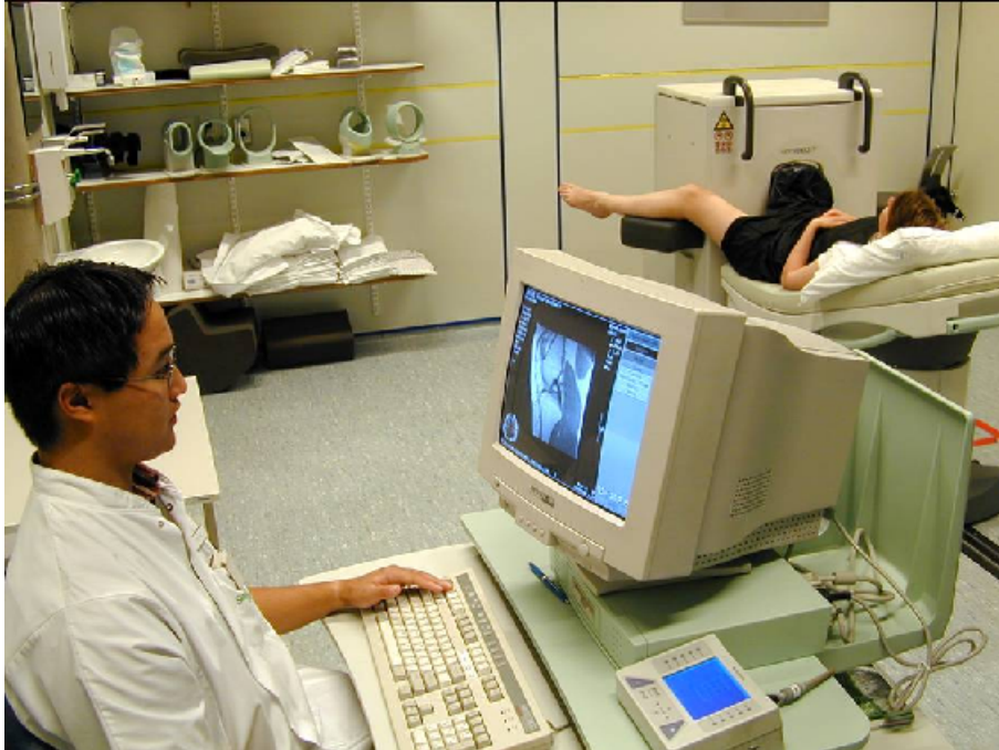
Figuur 1: Dedicated extremity MRI-scanner

In dit proefschrift worden diverse aspecten van MRI bij traumatisch knieletsel beschreven, waarbij allereerst een overzicht van de beoordeling van de meest voorkomende traumatische knieletsels op MRI en een systematische review naar de diagnostische accuratesse van MRI voor meniscus- en kruisbandscheuren worden gepresenteerd, gevolgd door twee prospectieve studies met betrekking tot MRI na knieletsel.