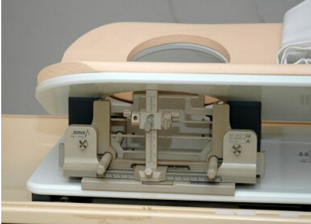
Figuur 3: [bij hoofdstuk 6:] Dedicated mammaspoel met add-on biopsy device (voor 3T)