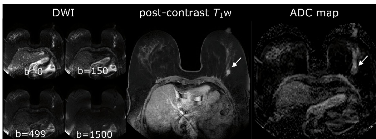
Figuur 1: [bij hoofdstuk 4:] Voorbeeld van DWI-beelden. T 1 w-beelden na contrast en ADC-map bij een patiënt met een invasief ductaal carcinoom in de linker mamma.

De b -waarden bepalen de mate van diffusieweging in diffusion-weighted imaging (DWI). De invloed van de keuze van de b -waarden op de apparent diffusion coefficient (ADC) van verdachte, non-palpabele mammalaesies in kwantitatieve DWI van de borst op 3T wordt bestudeerd in hoofdstuk 4.